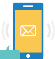
NotifyApp 超市 - 攝影機2：位移偵測